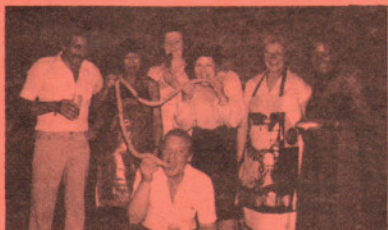
Un grand bravo aux dames du service « saucisses » accompagnées de la présidente et de deux gais lurons.