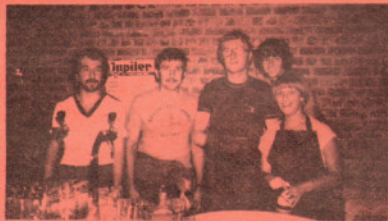
La maison des Jeunes était de service et celui-ci fut impeccable.

Notre photographe de service a croqué quelques clichés de cette magnifique soirée.