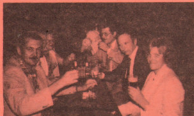
Ambiance du tonnerre ; jugez-en vous-même !!!