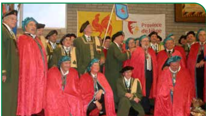
À gauche, au temps des Cerises... et des Poires !