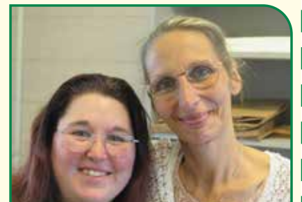
Une partie de l'équipe !