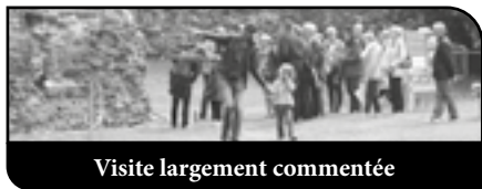
Visite largement commentée

Lors de ces deux jours, les visiteurs ont eu l'occasion de profiter d'un programme spécial :