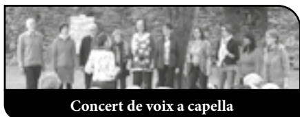
Concert de voix a capella