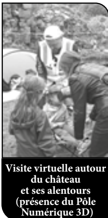
Visite virtuelle autour du château et ses alentours (présence du Pôle Numérique 3D)

Il est clair que la météo n'a pas encouragé les curieux à sortir de leur cocon, il est vrai que le samedi a eu ceci d'avantageux, c'est que la nappe phréatique a bien rempli le puits... En revanche, un dimanche bien achalandé.