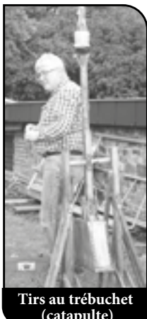
Tirs au trébuchet (catapulte)