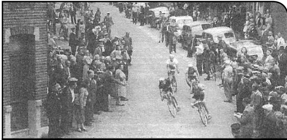
1 : Les courses à Housse : lors d'un passage devant la maison communale.

Il y a tout juste 60 ans, le 5 août 1958, le Comité Sportif de Housse organisa le Championnat cycliste de Belgique. Ce n'était pas son coup d'essai. Il y a toujours eu des courses cyclistes à Housse, organisées par un Comité Sportif très dynamique. (photo 1)