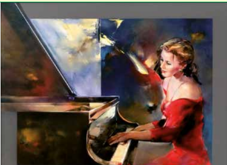
Peinture de Jacques Donnay