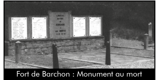
Fort de Barchon : Monument au mort