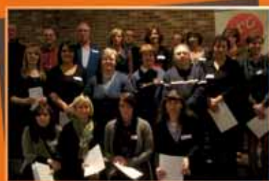
Les diplômés du BEPS et leurs instructeurs de la Croix-Rouge