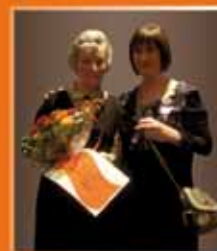
49 ans au service de la Maison de Repos St Joseph