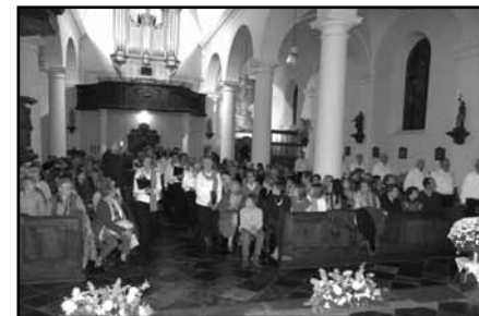
La chorale part du fond de l'église en chantant, et va prendre place dans le chœur.

Le concert de Trembleur aura donc lieu à Mortier.