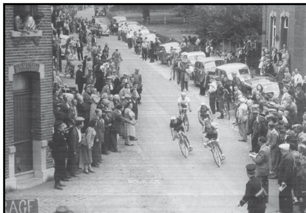
Les courses à Housse, lors d'un passage devant la maison communale

L'« event » sportif de l'année à Housse était la course en deux étapes : Berg-Housse et le lendemain Housse-Berg régulièrement gagnée par Impanis. L'intermède était le bal dans « La guingette » lors de l'arrivée à Housse. Dans une ambiance folle, on y rencontrait les vedettes, les soigneurs, les journalistes, les motards de la police de la route (« les zwaantjes ») qui faisaient sauter les filles sur l'air de « la danse du Spirou ». On y parlait tous les dialectes de Flandre et de Wallonie. Puis les coureurs allaient loger chez l'habitant et tout le village sentait l'embrocation.