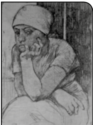
Rassenfosse, La Hiertcheuse

Au total des chiffres relevés à l'échelle locale, ce sont des sommes considérables de plusieurs centaines de milliers de francs que chaque commune a empruntées sur ce temps de guerre. Une bonne partie de ces sommes leur a permis d'apporter une assistance financière appréciable et continue à leurs bureaux de bienfaisance.