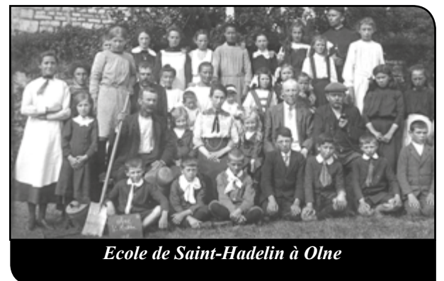
Ecole de Saint-Hadelin à Olne