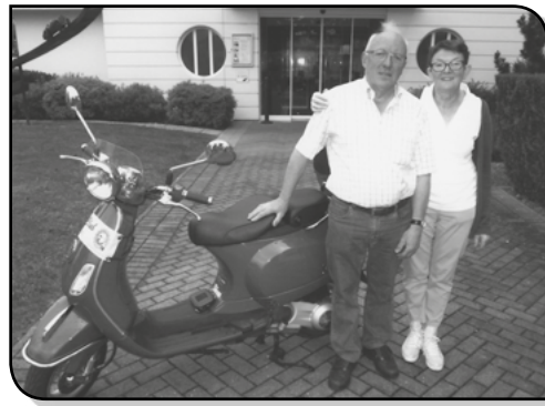
sages traversés ?

La Vespa eut très tôt ses adeptes, regroupés en clubs (en Belgique, au total, on compte pas moins de 2800 affiliés répartis sur une trentaine de clubs). Chaque année, chacun des clubs met sur pied une randonnée d'une centaine de kilomètres à laquelle il convie les membres des autres clubs. Ces balades motorisées, agrémentées de pauses conviviales (petit déjeuner, repas de midi, repas du soir), se font en fait à un train de... sénateur (40 à 45km/h maximum, à ne dépasser sous aucun prétexte, même par les Vespas les plus puissantes de 300cc), et la sécurité y est assurée avec le plus grand sérieux sous la houlette d'un capitaine de route, avec casques et vêtements fluo de rigueur, gants de protection, etc...etc... Ne voilà-t-il pas un mode de locomotion qui permet bien sûr de s'aérer, qui procure une certaine ivresse (dans le bon sens du terme) à la conduite, et qui laisse tout loisir au conducteur et à son éventuel passager d'admirer les pay-