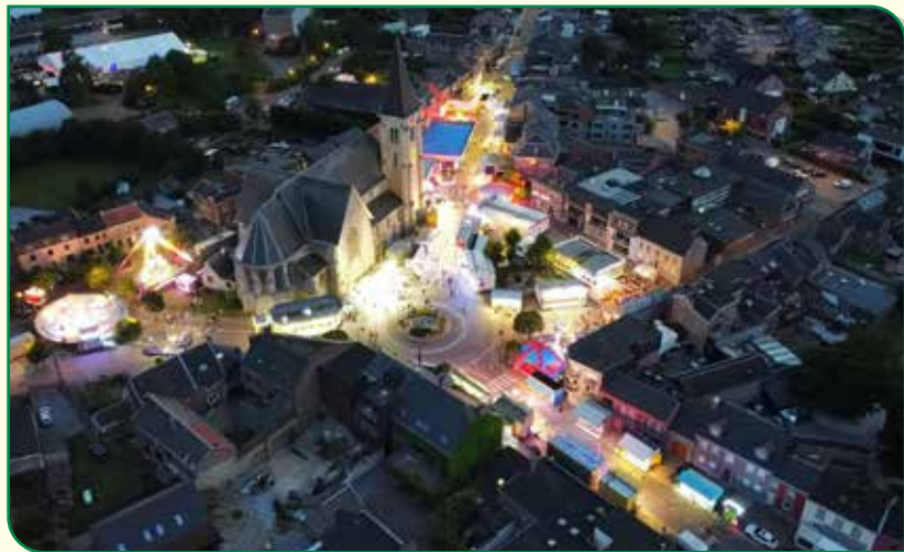
prise le 11 juillet 2023 vers 22h