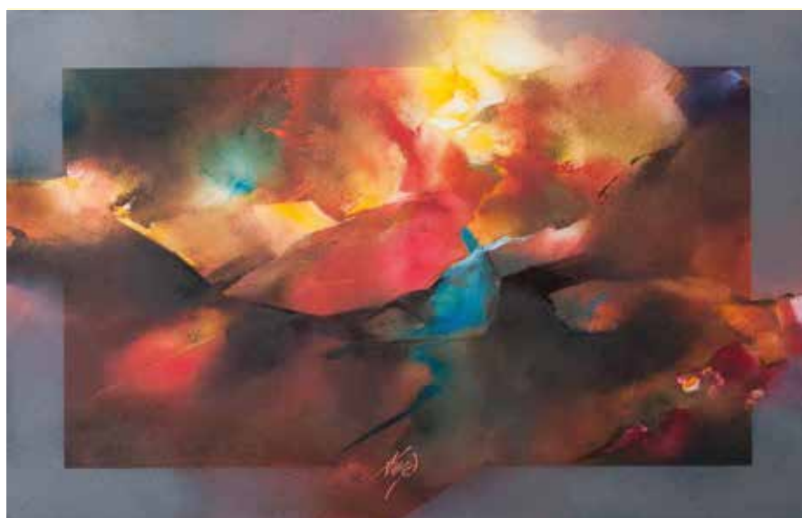
Peinture de Jacques Donnay