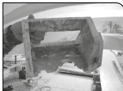
Gabarit de moulure