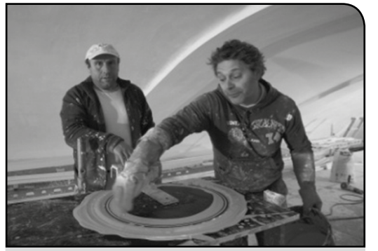
Table de travail