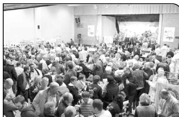
Vue du nombreux publics