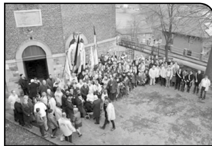
Les Membres réunis avant la messe

Après une célébration en l'église du même nom et un recueillement au monument aux morts, l'inauguration officielle de cette année festive s'est déroulée dans une salle de la Jeunesse remplie à craquer.